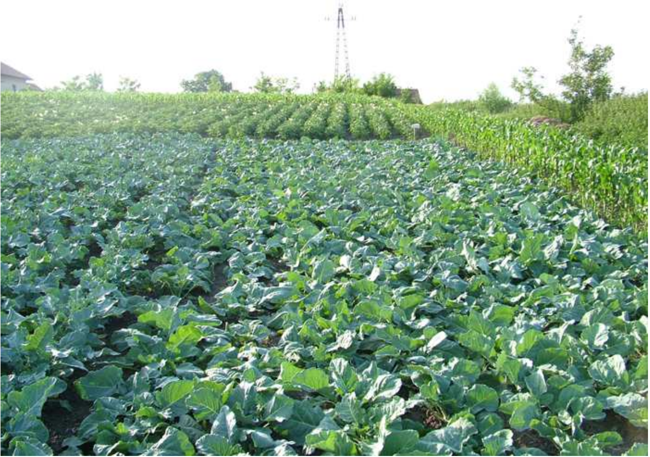
Dúsan termő növények a „Reményes”-ben