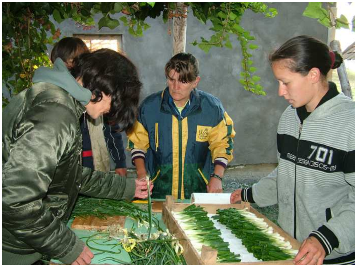
Az újhagyma előkészítése szállításra