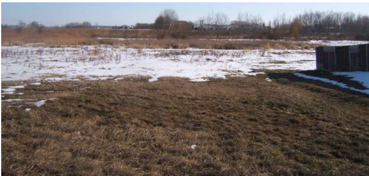
A kertészet részére kijelölt terület a megművelés előtt (2012. február 22.)

Március 20.-ig nagyon nagy erőfeszítések árán két kis rotációs kapával aprítottuk a talajt. Sajnos ez sem tette lehetővé a talaj aprómorzsás magágy megteremtését. Az önkormányzat eszközállományában talajmaró nincs, éppen ezért ennek a jövőbeni eszközállomány beszerzésében feltétlenül szerepelnie kell.