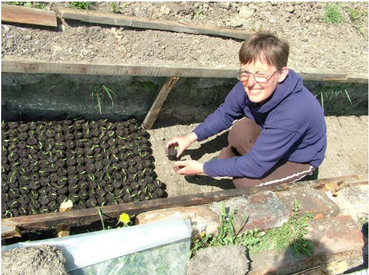
Tápkocka készítése és tápkockák a földbe süllyesztett meleg-ágyban