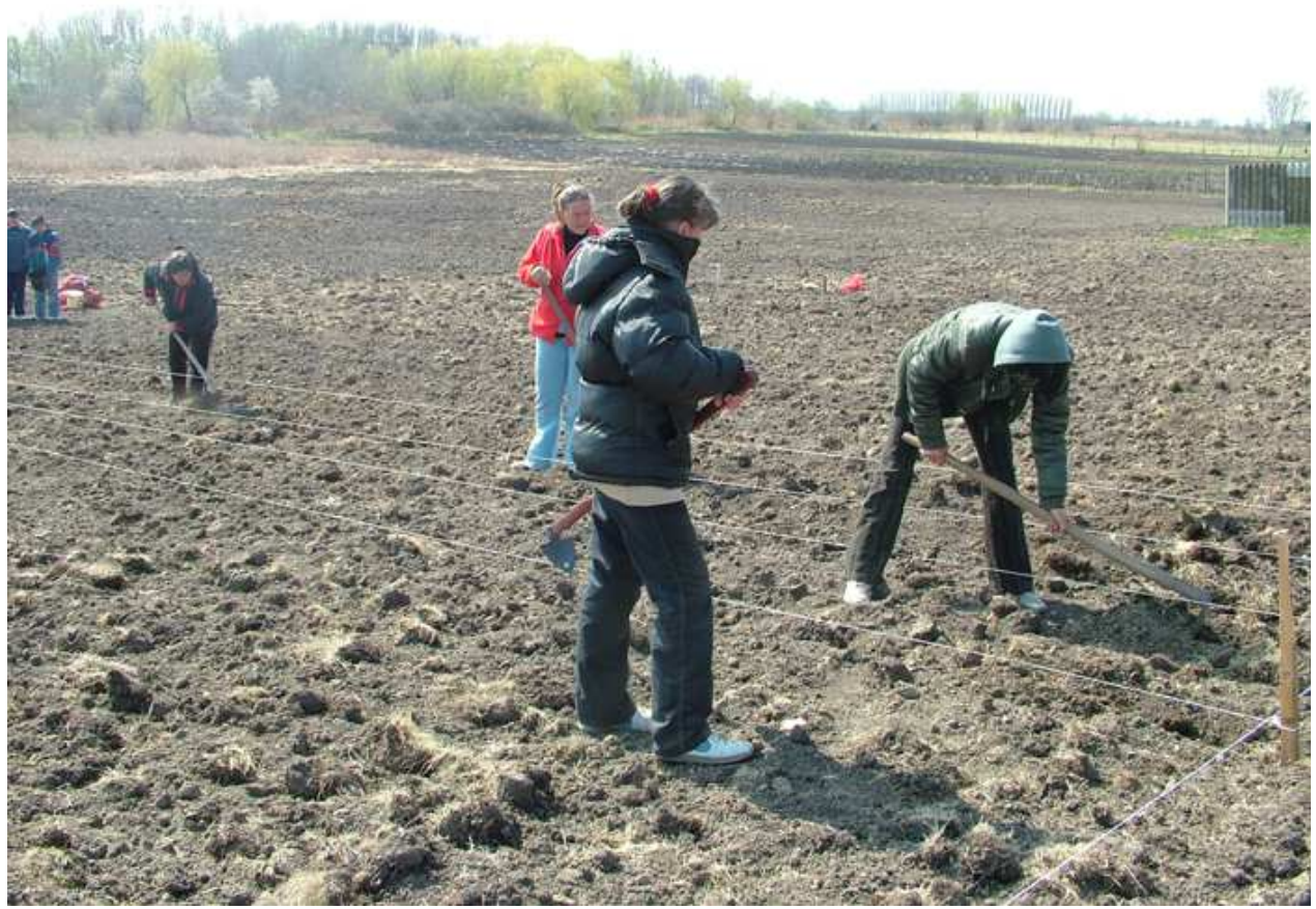
Barázdák előkészítése és a krumpli vetése