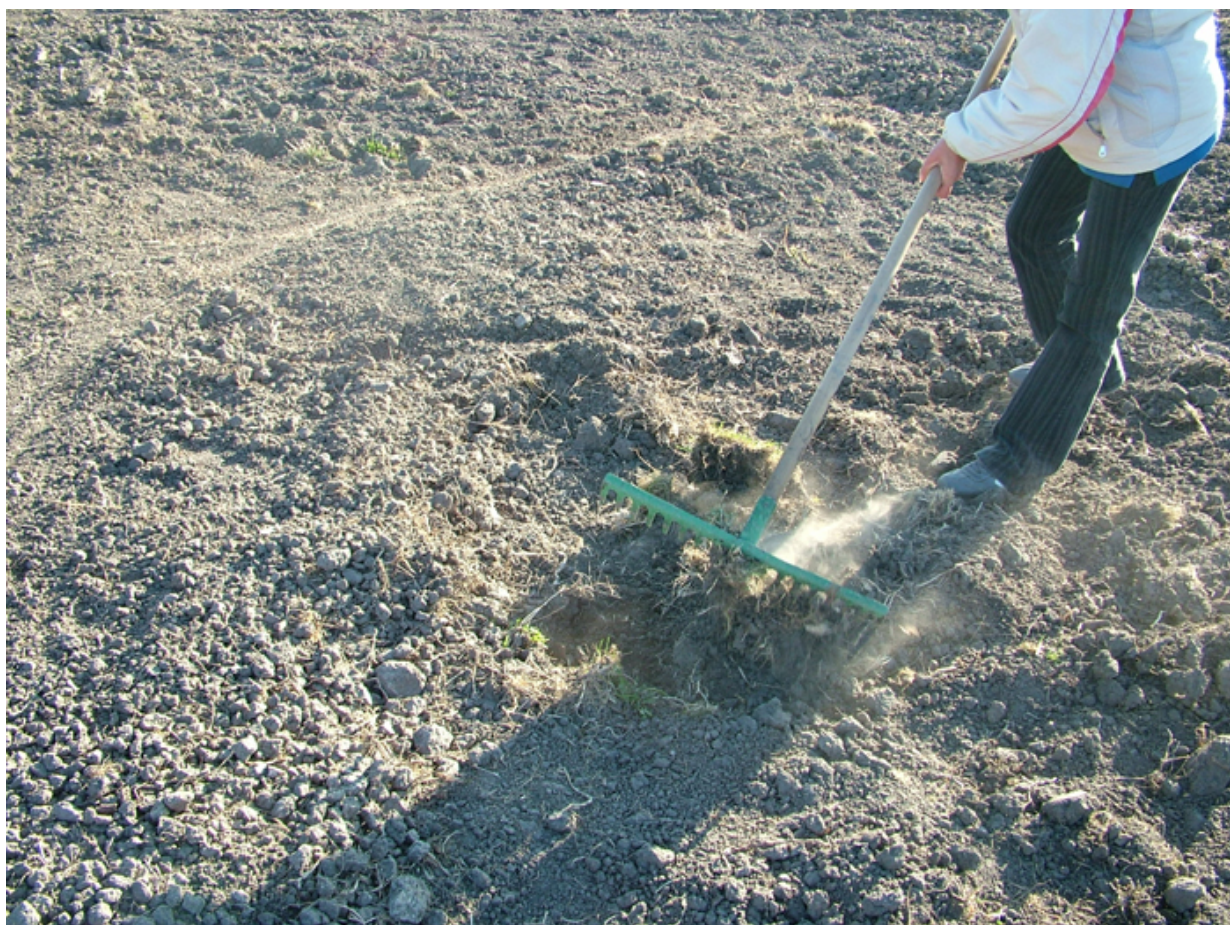
Kézi erővel műveljük a talajt

Megtanulták például azt, hogy a zeller fényen csírázik, kétszer tűzdeljük. Mi a pikírozás és miért fontos dolog. Megtanulták a munkák során használt eszközök nevét: rosta, tűzdelő-fa, inejkt, sorhúzó, tömörítő-fa, stb.. Megmutattam nekik, miként kell ezeket használni.