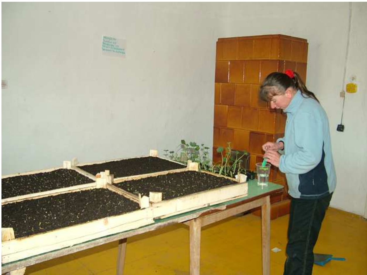
Magvetés, palántanevelés lakószobában