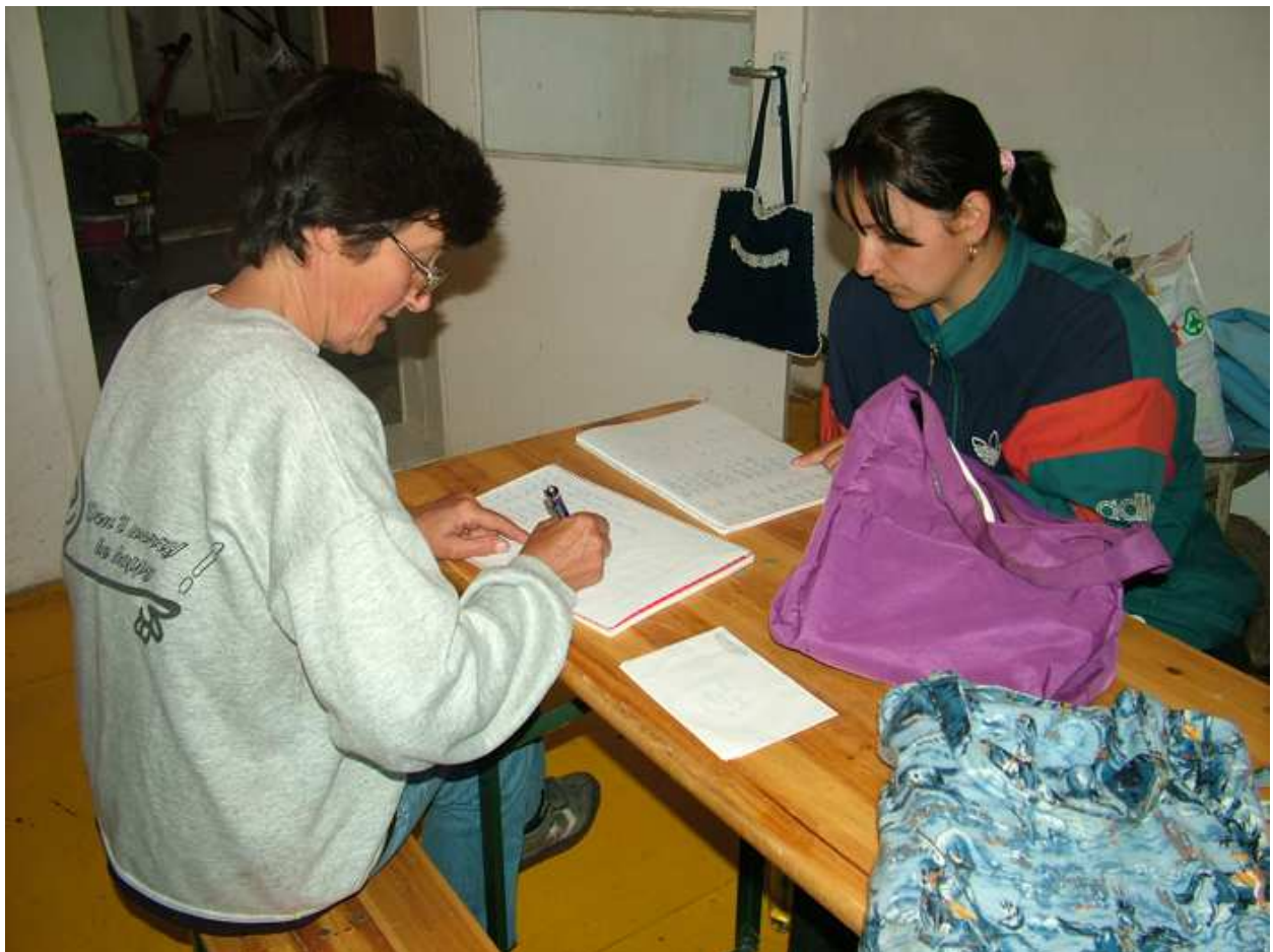
Egy kis helyi „vizsga”