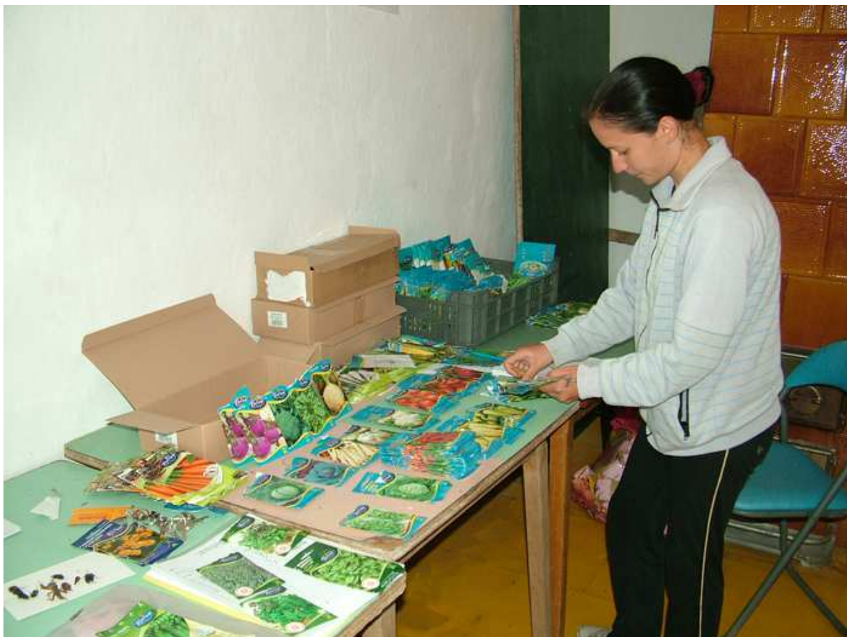
A vetőmagok rendszerezése

A költség erre a programra egy 5.000.000 Ft-os kerettel indult, ezért nagyon meg kellett fontolni az eszközökre fordítható pénz összegét. Költségtakarékos gondolkodás végeredménye volt a faládák készíttetése is. Ezek szaporító ládaként, majd a későbbi a kész termények szállítására is szolgál. erre már csak azért is szükség volt, mivel első alkalomkor a vadonatúj műanyag szaporító ládákat szállítottuk az árut és cserébe törött ládákat kaptunk vissza, ezért a továbbiakban a faládákba szállítottuk az árut. Ezek után már a mi eszköz állományunkat nem amortizálhatták le mások.