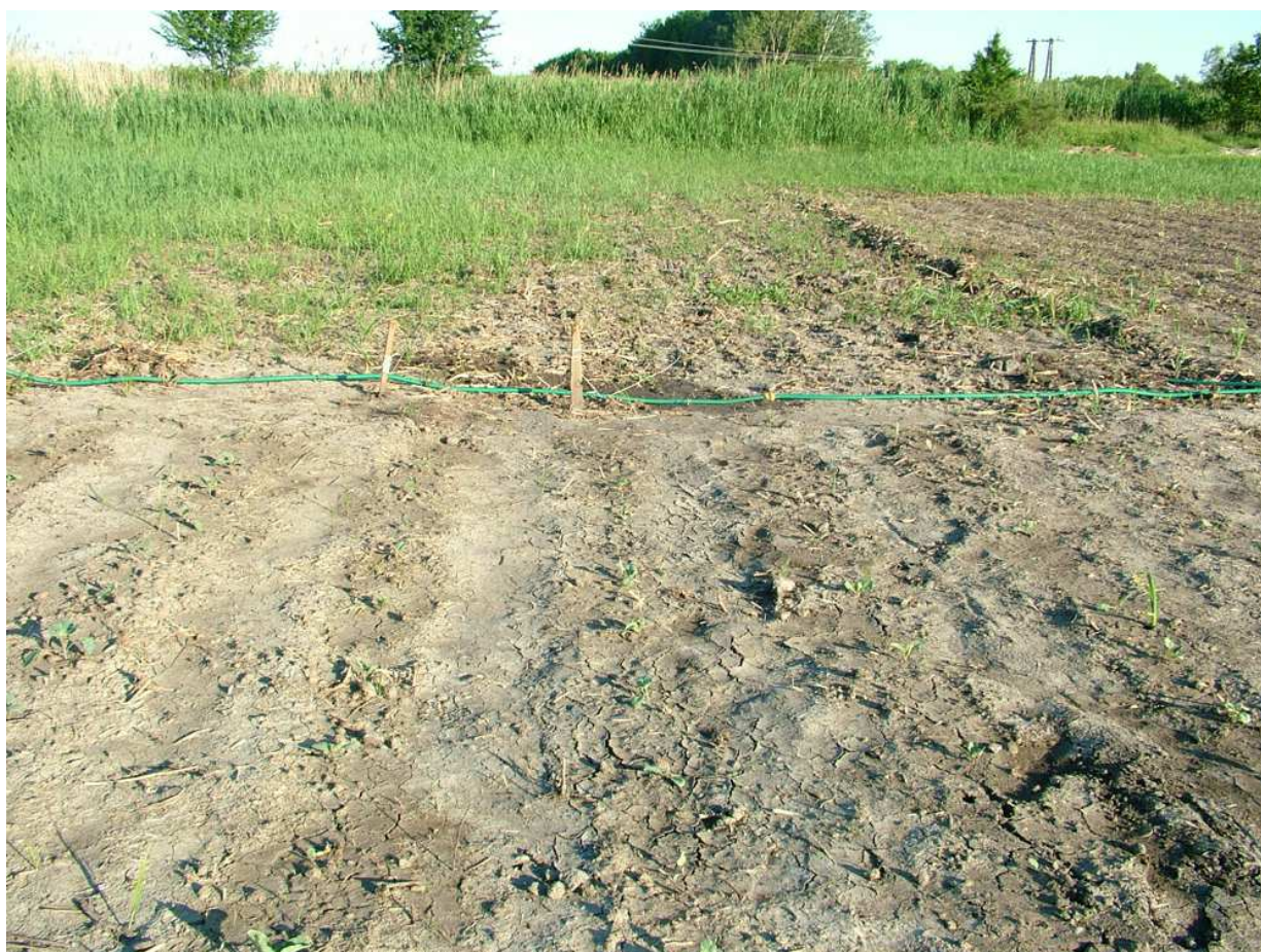
Elöl a palánták, de hátul már a nád és a sás követeli vissza régi életterét

A megtermelt áru közétkeztetésre került. A gyerekek boldogok voltak, hogy azokat a zöldségfélét eszik, amelyeket a szüleik állítottak elő. Nem dobálták el és boldogan mondták többen is: „olyan finom volt, hogy hat darab zöldhagymát is megettem”. Ennél nagyobb elismerés, mint amit egy gyerek adhat, talán nincs is.