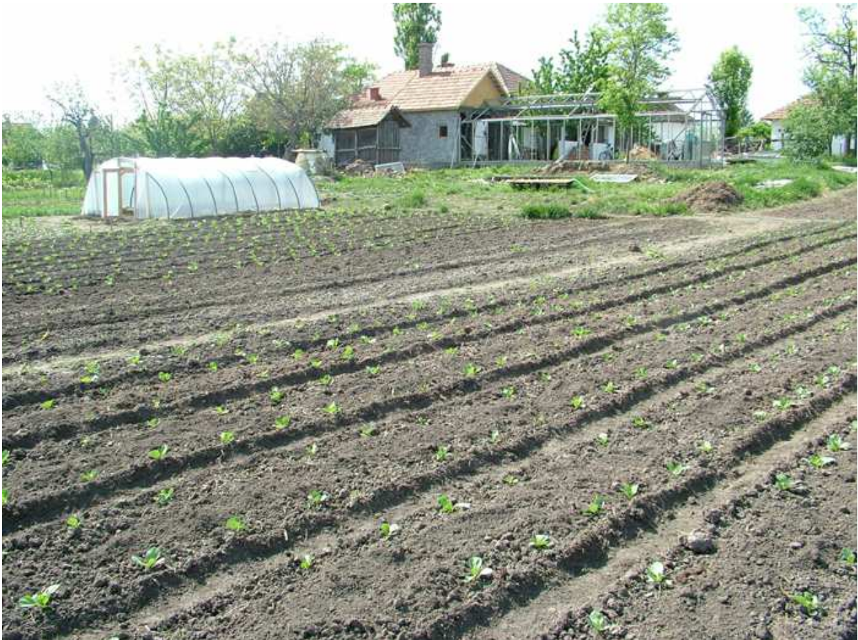
Palánták a fóliasátorban és a szabadban