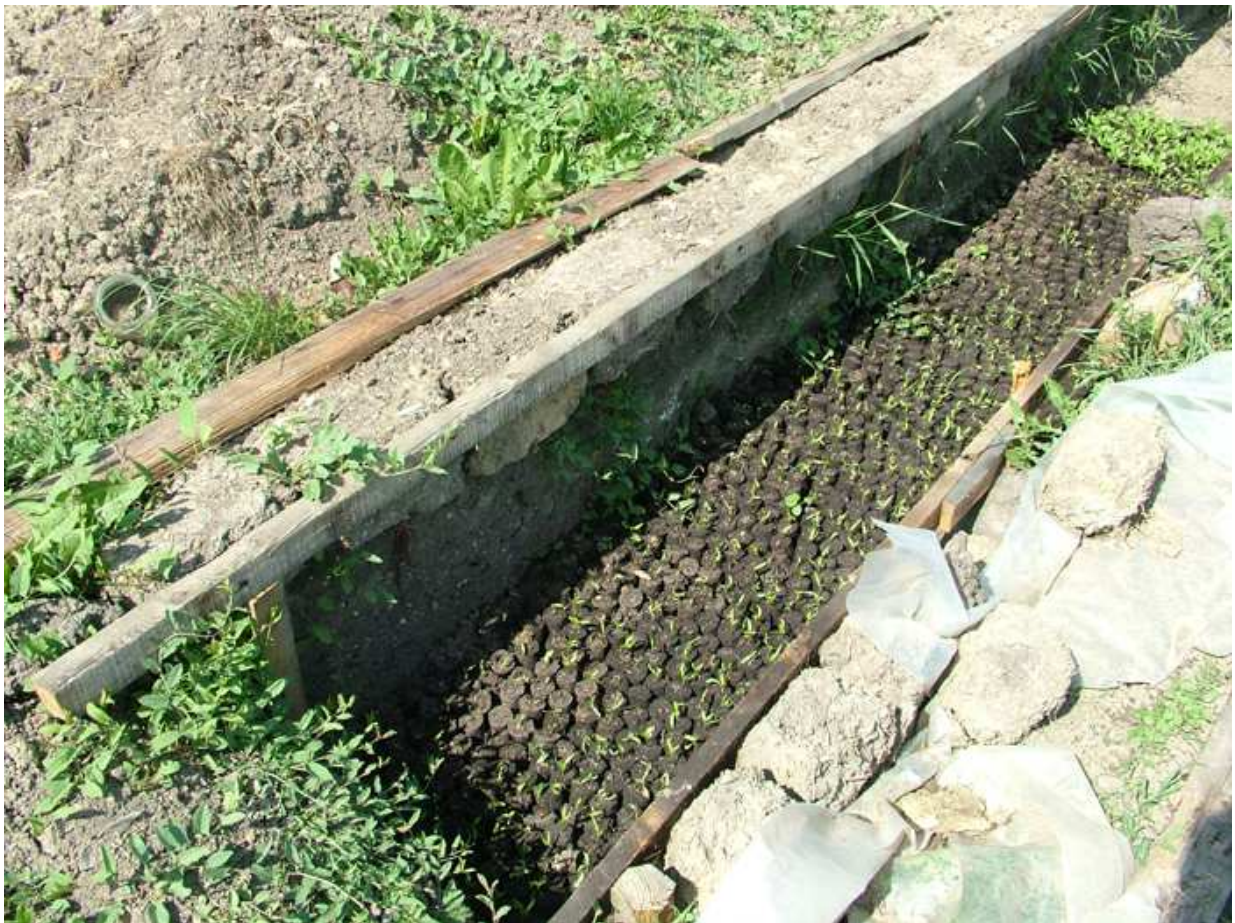
Földbe süllyesztett meleg-ágyás