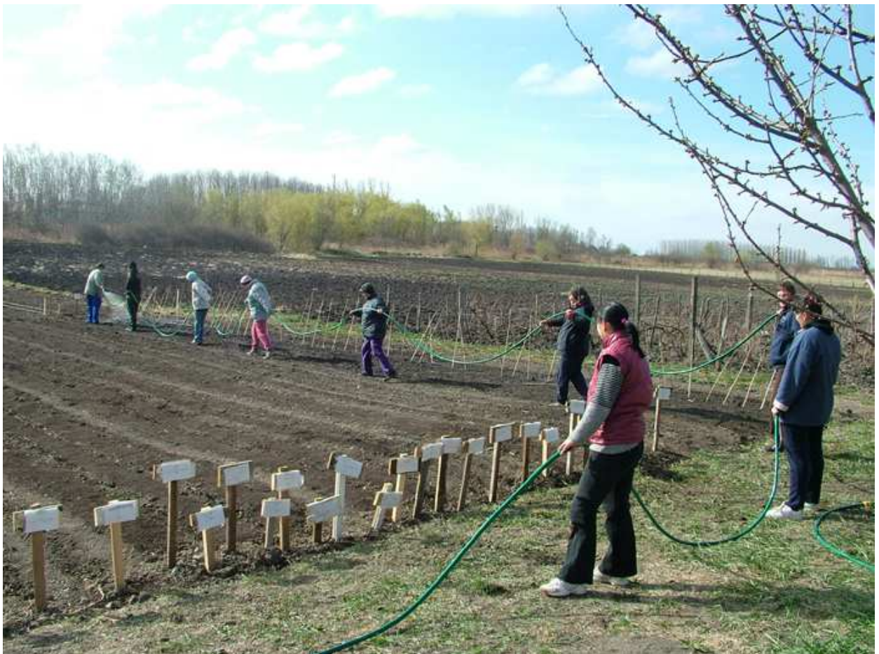
Öntözés kannával és tömlővel