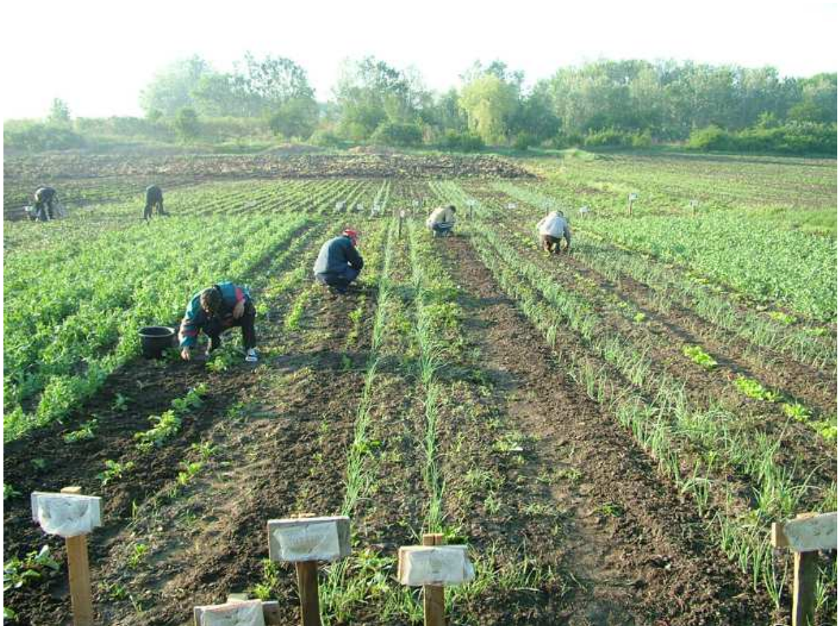
Fejlődő növények a „Reményes”-ben